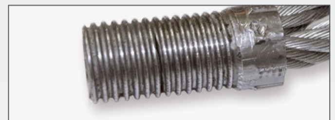
Bruch des Gewindeteils