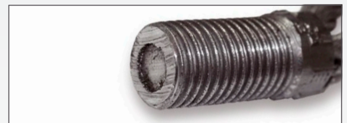
Seilauszug aus Gewindeteil