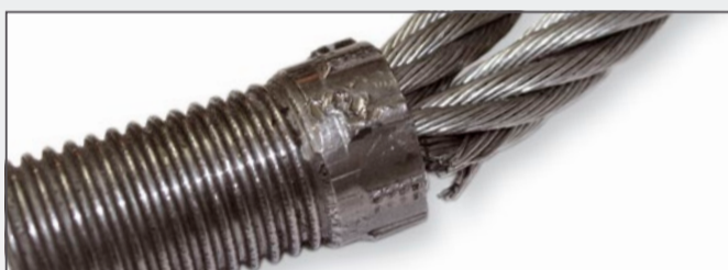
Bruch einer Litze