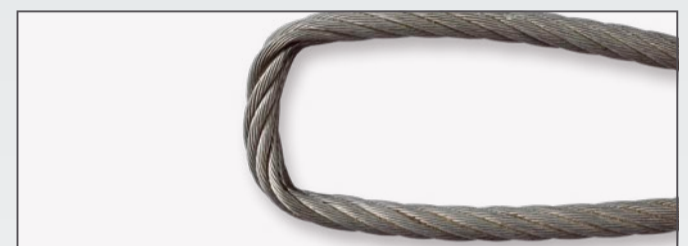
Quetschungen im Auflagebereich