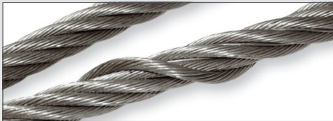
Lockerung der Außenlage

Vor der Überprüfung ist die Seilschlaufe zu reinigen. Es sind folgende Kriterien zu beachten: